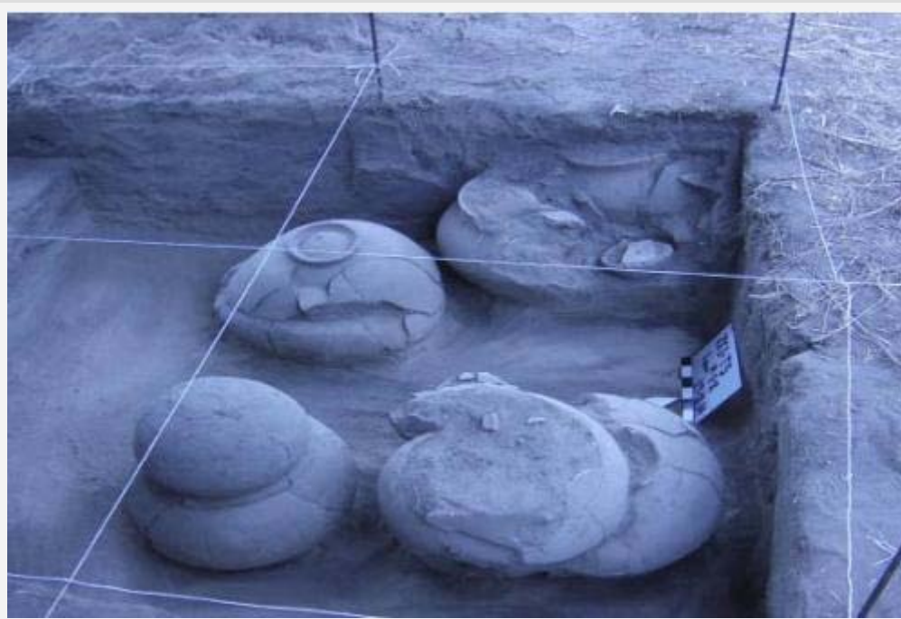
Figura 3. Yacimiento arqueológico en el sitio de la Mesa. Municipio Cabimas.