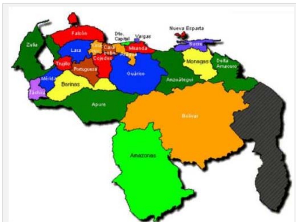
Figura 1. Ubicación geográfica de la Costa Oriental del lago.

Su ubicación y geografía es además conveniente para una posible ruta de tránsito para los grupos prehispánicos ya que la comunicación por vía lacustre, fluvial o terrestre no presenta mayores obstáculos naturales. De igual manera, dicha ubicación representa un sitio estratégico en cuanto al control y disposición de recursos.